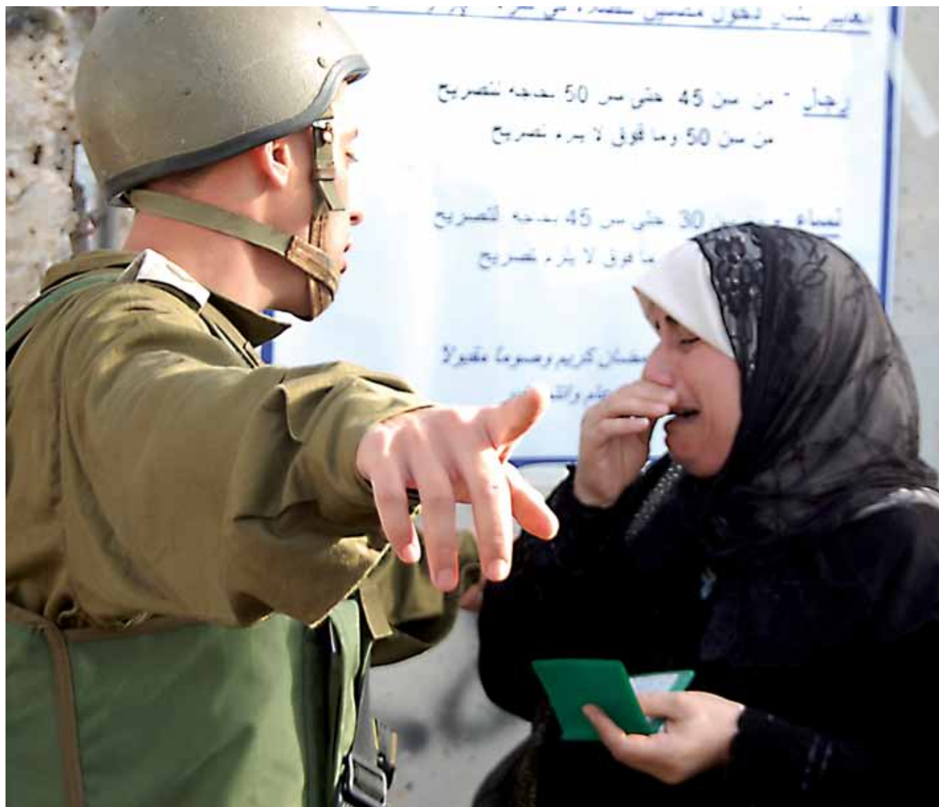
Palestinsk kvinne og israelsk soldat ved checkpoint