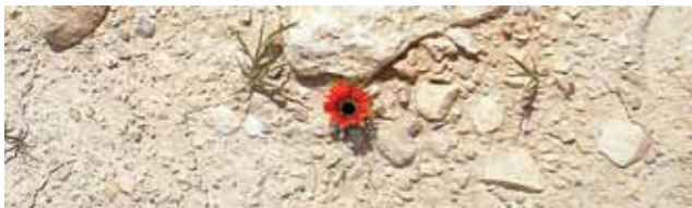
«Signs of Hope» - en blomst i tørr jord ved Tantur, Betlehem