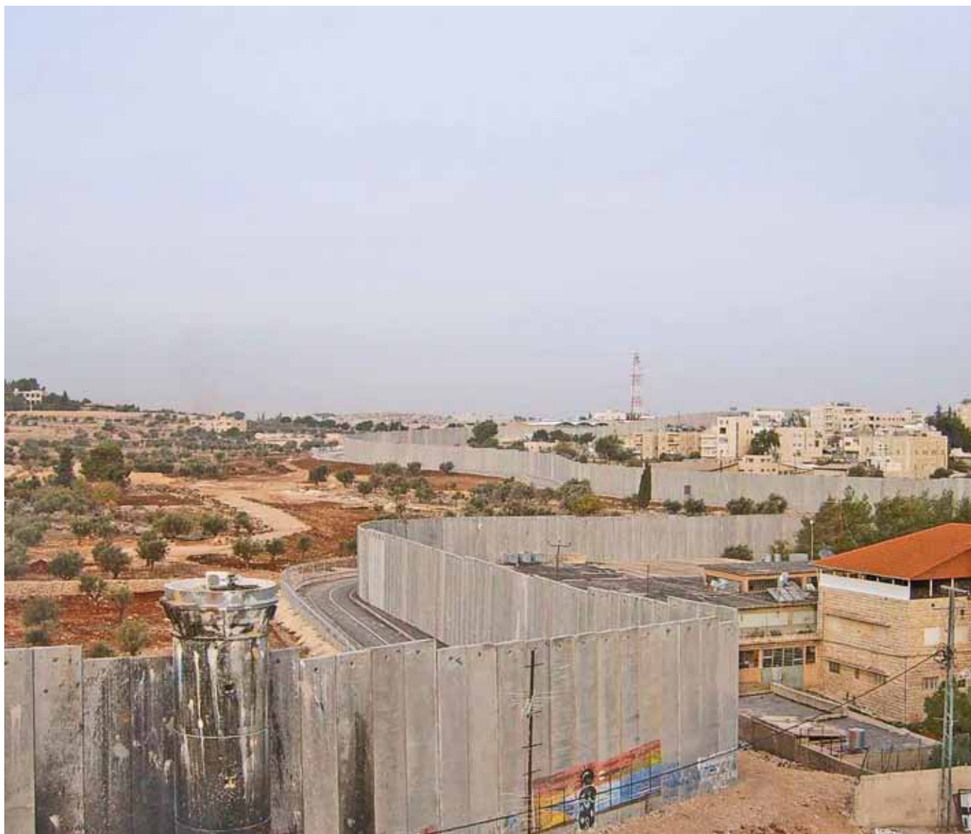
Muren ved Betlehem