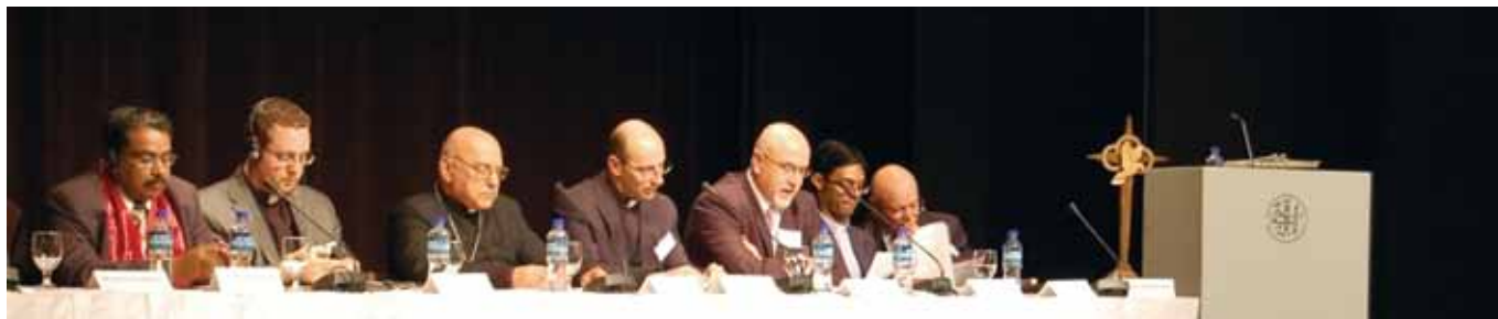
Fra lanseringen av det palestinske Kairos-dokumentet i Betlehem, 11.desember2010